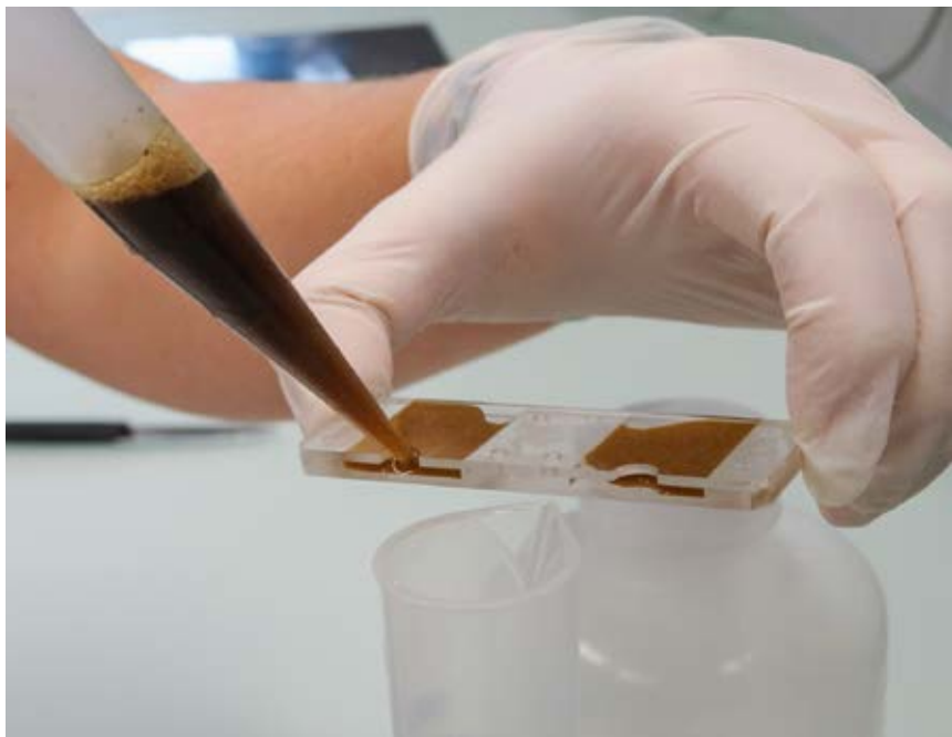
Einfüllen der Kotsuspension in eine sogenannte McMaster-Kammer zur späteren mikroskopischen Erfassung der Parasiteneier. Introduction d'une suspension d'excréments dans une lame McMaster, pour ensuite dénombrer au microscope les œufs de parasites.

Milchziegen und Milchschafe werden häufig zur Galtzeit entwurmt. Deshalb besteht hier die weiter oben angesprochene Risikosituation einer Behandlung aller Tiere mit anschliessendem Austrieb auf eine (nach der Winterruhe) gering kontaminierte Weide. Bei Ziegen, die im Vergleich zum Schaf eine weniger ausgeprägte Immunität zeigen, könnten Kotproben verschiedener Tiergruppen genaueren Aufschluss darüber geben, welche Tiere entwurmt werden sollten oder nicht. Ein Ansatz bei Milchziegen könnte sein, einige Tiere mit relativ geringer Milchleistung von der Behandlung auszunehmen. In einer französischen Studie konnte gezeigt werden, dass die