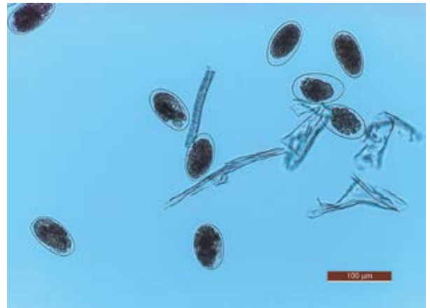
Eier von Magen-Darm-Würmern unter dem Mikroskop. Œufs de vers gastro-intestinaux au microscope.

drei Wochen um geschlechtsreif zu werden und beginnen dann wiederum mit der Eiablage. Die Eier von Magen-Darm-Würmern sind sehr widerstandsfähig und können je nach Witterung über mehrere Monate auf der Weide überdauern und teilweise dort sogar überwintern.